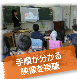
手順が分かる映像を視聴

手順が分かる映像を視聴したことで、細かい指の動きや針の使い方についてイメージを持ちながら練習することができました。