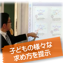
子どもの様々な求め方を提示

様々な求め方を学級全体で共有したことで、自分の考えと比較したり、新たな考えに気付いたりすることができました。