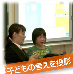
子どもの考えを投影

一人の考えを学級全体で共有したことで、自分の考えと比較したり、新たな考えに気付いたりすることができました。